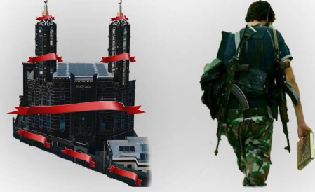
موجة غضب وانكار من أهالي المحرر والمجاهدين لافتتاح مسجد شبه بحسينيات الشيعة وعدم افتتاح معركة

بعد 400 يوم من القتل والقتال الدامي في غزة، لا تزال حركة حماس صامدةً في غزة، وبعد قتل قائدها في الداخل "السنوار" لم يظهر عليها أثرٌ سلبيٌّ لذلك، بل ما زالت تحاول فرض شروطها على العدو لإجباره على الانسحاب إلى مواقعه قبل الاجتياح، ويحاول العدو التصعيد ميدانياً وسياسياً، وقد ظهر ذلك في تصريح لقيادة قطر أنها انسحبت من دور الوساطة في التفاوض بين حماس و"إسرائيل"، وهناك إشاعات أن قطر، ستطلب من قادة حماس مغادرتها بناء على ضغوط أمريكية، وهذا واردٌ إذ أن السماح بقائهم رغبةً أمريكيةً لاستمرار خيط التواصل والتفاوض، وإذا استحال التأثير على حماس بذلك سيلجأون إلى مثل هذا الضغط، بالإضافة إلى الضغط الميداني، نسأل الله أن ينصر إخواننا المجاهدين في غزة نصراً مؤزراً، وأن يجعل كبد الكافرين في نحورهم، اللهم آمين.