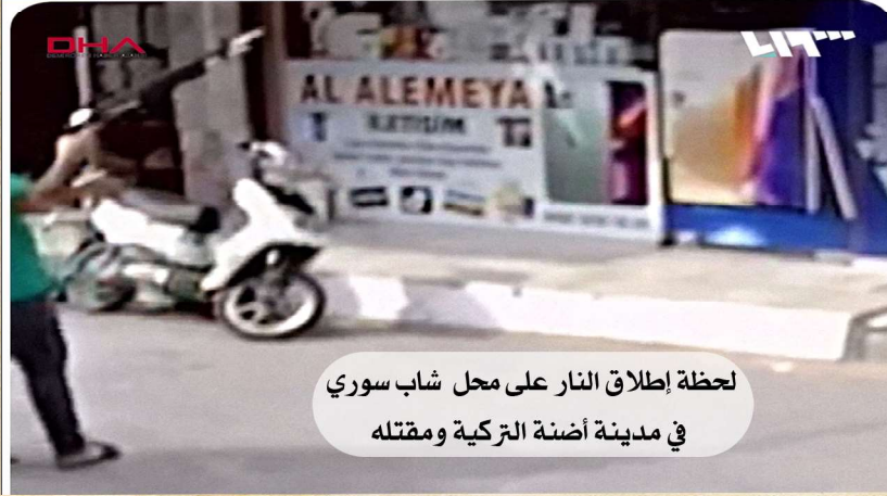
لحظة إطلاق النار على محل شاب سوري في مدينة أضنة التركية ومقتله

تصاعدت في الآونة الأخيرة وتيرة الاعتداءات على السوريين في تركيا، فلا يكاد يمر يوم إلا ونسمع فيه أن بعض العنصريين الأتراك ضربوا أو أخذوا إتاوة أو قتلوا أحد السوريين الذين فروا من جحيم القصف الأسدي إلى تركيا، وهذا يستدعي منا بيان أمور: