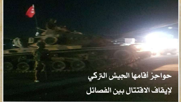
حواجز أقامها الجيش التركي لإيقاف الاقتتال بين الفصائل

أصدرت الخزانة الأمريكية نشرة فيها قرار بفرض عقوبات على فرقة السلطان سليمان شاه وفرقة الحمزة التابعين للجيش الوطني، بسبب الانتهاكات التي تمارسها الفرقتان كما جاء في البيان، وبالمقابل حشدت قيادة الفرقتين الأتباع الأنصار للتظاهر ضد القرار الذي وصفوه بالجائر، وعلق آخرون أن الولايات المتحدة لم توفر أكثر الفصائل فساداً وتمسحاً بها من التصنيف والعقوبات، فكيف بغيرها من فصائل حرة ومجاهدة، كما أن فساد هؤلاء لا يعدل شيئاً من فساد وجرائم قسد، لكنها المصالح، ومصالحة الولايات المتحدة ضد الثورة السورية ككل.