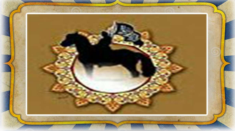
بسم الله الرحمن الرحيم

– في بيعة الرضوان وصلح الحديبية: وقد وردت السكينة في ثلاث آيات تتعلق بهذه الحادثة، قال تعالى: (إِنَّا فَتَحْنَا لَكَ فَتْحًا مُّبِينًا * لِيَغْفِرَ لَكَ اللَّهُ مَا تَقَدَّمَ مِنْ ذَنْبِكَ وَمَا تَأَخَّرَ وَيُتِمَّ نِعْمَتَهُ عَلَيْكَ وَيَهْدِيكَ صِرَاطًا مُسْتَقِيمًا * وَيَنْصُرَكَ اللَّهُ نَصْرًا عَزِيمًا * هُوَ الَّذِي أَنْزَلَ السَّكِينَةَ فِي قُلُوبِ الْمُؤْمِنِينَ لِيَرْدُؤُوا إِيمَانًا مَعَ إِيْمَانِهِمْ وَلِلَّهِ جُنُودُ السَّمَاوَاتِ وَالْأَرْضِ وَكَانَ اللَّهُ عَلِيمًا حَكِيمًا).